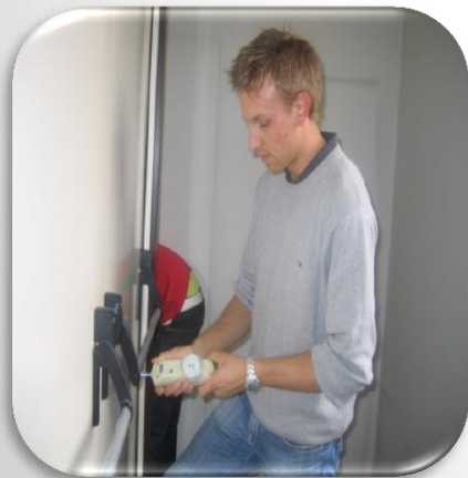
Corso / modulo per manutentore di porte tagliafuoco