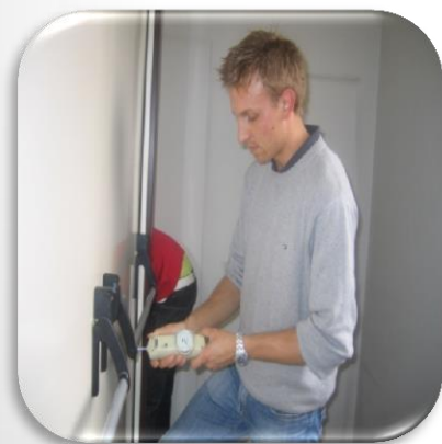
Manutentore di porte e portoni tagliafuoco

Il tecnico manutentore frequentava i corsi di formazione suddivisi nei tre moduli (manutenzione estintori, componenti di reti idranti e porte tagliafuoco) per i quali riceveva da M.A.I.A. gli attestati di frequenza. In seguito si presentava all'esame teorico e pratico e, superato le prove, otteneva dall'Ente di Certificazione un certificato per le tre competenze acquisite