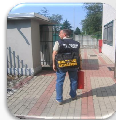
Manutentore di estintori portatili e carrellati