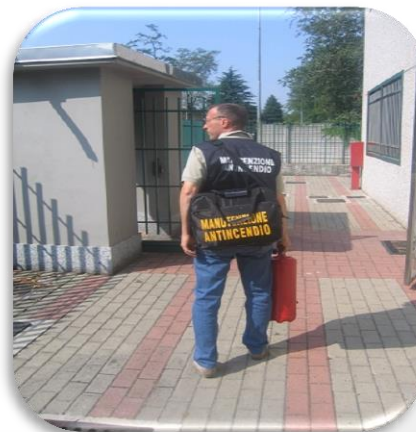
Corso / modulo per manutentore di estintori