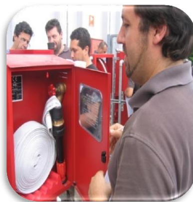
Manutentore di componenti di reti idranti