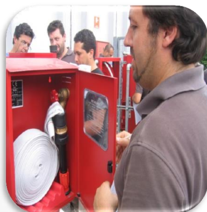
Corso / modulo per manutentore di componenti di reti idranti